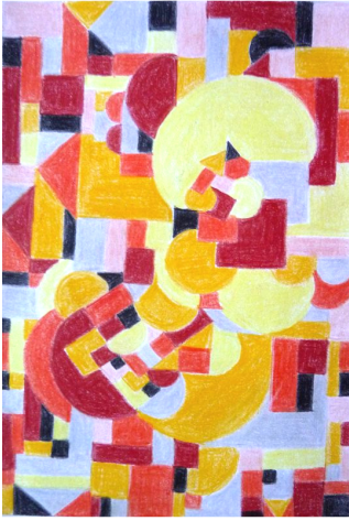
„ El Dia - der Tag “ (Entwurf) 2004 Ölkreidebuntstifte auf Papier, 15 x 10 cm